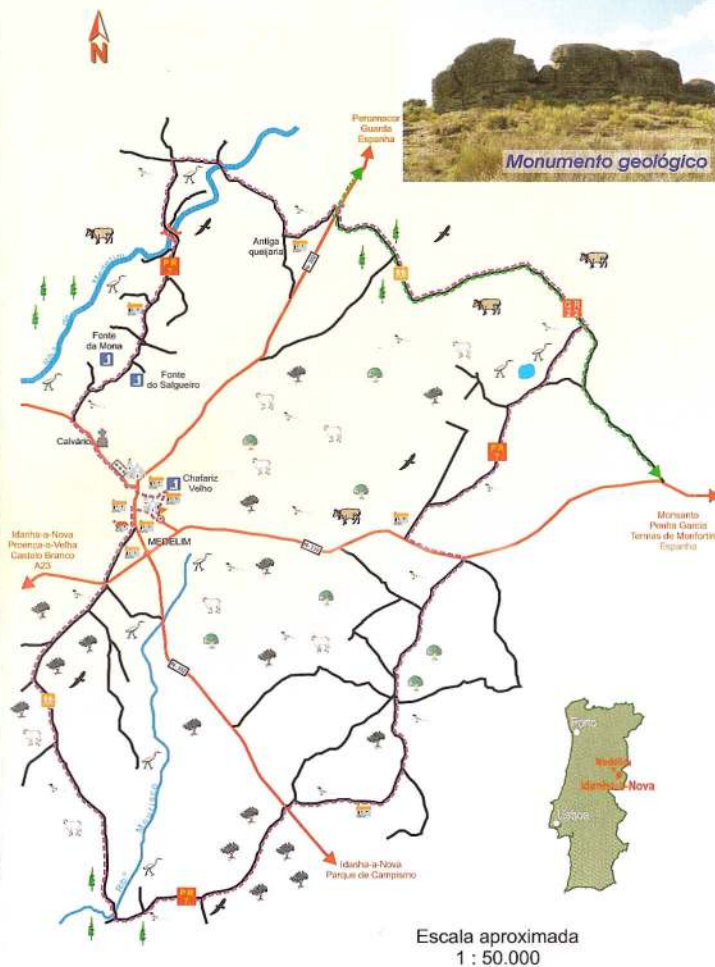
Escala aproximada 1 : 50.000