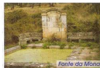
Fonte da Mona

Esta paisagem moldada pelo homem desde as brumas do tempo constitui um excelente habitat para a avifauna sendo frequentes grandes bandos de Pega-azul ( Cyanopica cyanus ), Pega-rabuda ( Pica pica ), Estorninho-preto ( Sturnus unicolor ), Pombo-torcaz ( Columba palumbus ), etc.