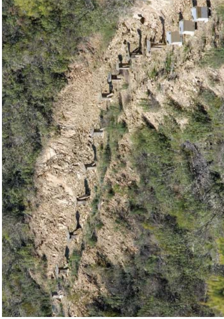
Apiário nas proximidades da Açude do Vale das Pedras