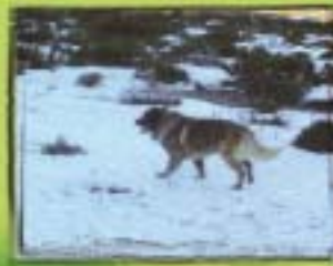
Cão Serra da Estrela