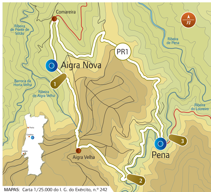
MAPAS: Carta 1/25.000 do I. G. do Exército, n.º 242 e 252