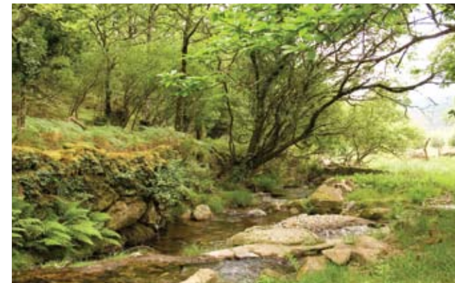
ribeira da pena

Na Aldeia da Comareira, assim designada dada a sua localização no cume de um monte, poderá sentar-se no miradouro e sentir que se encontra no topo do mundo. Por o clima ser agreste, as Aigras (Nova e Velha) têm particularidades únicas. Na Aigra Nova passe pela Rua dos Bois e visite a Loja da Aldeia e depois vá à Quelha da Burra, à Maternidade das Árvores, espaço de educação ambiental sobre a Serra da Lousã. Aproveite e apadrinhe uma árvore –ajude a reflorestação da Serra. Ainda na Aigra Nova, pare e pinte um quadro... A paisagem circundante é magnífica e inspira mesmo quem não tenha a vocação necessária. Esta aldeia ainda dispõe de um sistema defensivo apenas visto nas aldeias e vilas medievais mais antigas do nosso país. Na aldeia da Pena procure os fósseis marinhos, os moinhos, os Penedos, a Ribeira da Pena ou o Museu Particular da D. Giselda. Mesmo no Topo poderá ainda entrar em contacto com os palheiros antigos.