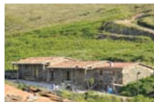
pormenor de uma casa na aldeia de Casal de S. Simão