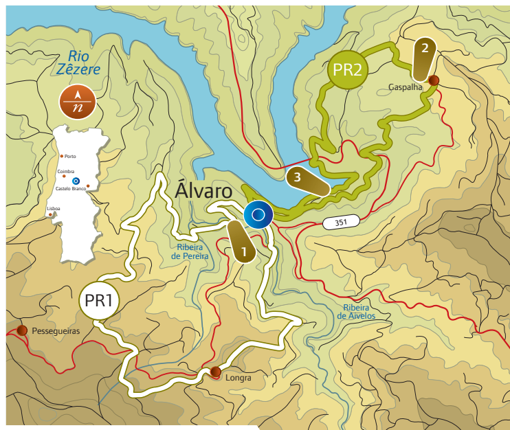
MAPAS: Carta 1/25.000 do I. G. do Exército, n.º 265