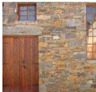
Detalhe de uma casa