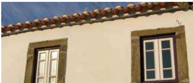
Pormenor de edifício

Sopa de Peixe; Peixe Frito do Rio (Achigã); Maranhos; Cabrito Estonado Bolo de Mel; Aguardente de Medronho; Vinho Callum