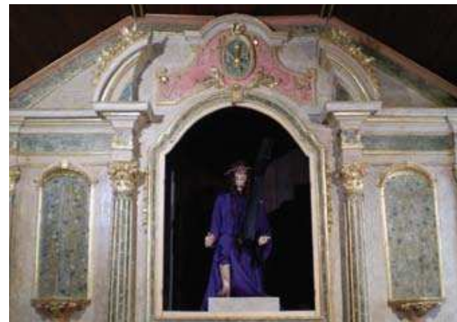
senhor dos passos

Esta é uma das aldeias brancas da Rede das ALDEIAS DO XISTO, uma vez que o casario é maioritariamente rebocado e pintado, evidenciando que a aldeia já foi uma mui nobre villa e sede de concelho. Um estatuto histórico herdado pela passagem de visigodos, romanos e pelo facto de ter sido uma importante base para a Ordem de Malta. A presença romana terá sido responsável pela construção de uma das pontes que ainda hoje une as margens da Ribeira de Alvélos. Esta freguesia é também marcada pela existência de Caminhos de Santiago e pelo seu espólio religioso de excepção. A Capela da Misericórdia classifica-se como Imóvel de Valor Concelhio. A sua fundação é muito antiga. Ao longo do século XIV a posse da Comenda de Álvaro foi disputada entre a Monarquia e a Ordem de Malta. D. Afonso V faz dela doação ao Senhor de Trofa. Em 1513, D. Manuel dá-lhe foral novo. Posteriormente, veio a pertencer à Casa de Marialva, mantendo porém a Comenda da Ordem do Hospital. A reforma administrativa do século XIX leva à perda da sua autonomia, tendo sido integrada como freguesia de Oleiros.