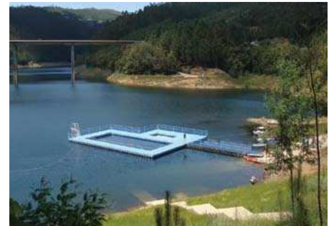
Piscina no rio Zêzere

Esta é uma das aldeias brancas da Rede das Aldeias do Xisto, uma vez que o casario é maioritariamente rebocado e pintado, evidenciando que a aldeia já foi uma mui nobre "villa" e sede de concelho. Um estatuto histórico herdado pela passagem de visigodos, romanos e pelo facto de ter sido uma importante base para a Ordem de Malta. A presença romana terá sido responsável pela construção de uma das pontes que ainda hoje une as margens da Ribeira de Alvêlos. Esta freguesia é também marcada pela existência de Caminhos de Santiago e pelo seu espólio religioso de excepção. A Capela da Misericórdia classifica-se como Imóvel de Valor Concelhio. A sua fundação é muito antiga. Ao longo do século XIV a posse da Comenda de Álvaro foi disputada entre a Monarquia e a Ordem de Malta. D. Afonso V faz dela doação ao Senhor de Trofa. Em 1513, D. Manuel dá-lhe foral novo. Posteriormente, veio a pertencer à Casa de Marialva, mantendo porém a Comenda da Ordem do Hospital. A reforma administrativa do século XIX leva à perda da sua autonomia, tendo sido integrada como freguesia de Oleiros.