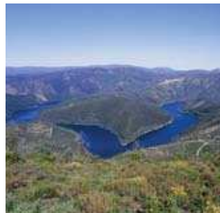
Meandros do Rio Zêzere

MAPAS: Carta 1/25.000 do I. G. do Exército, n.º 265