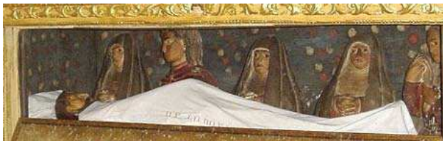
Senhor Morto e as Santas Mulheres

Sopa de Peixe; Peixe Frito do Rio (Achigã); Maranhos; Cabrito Estonado Bolo de Mel; Aguardente de Medronho; Vinho Callum