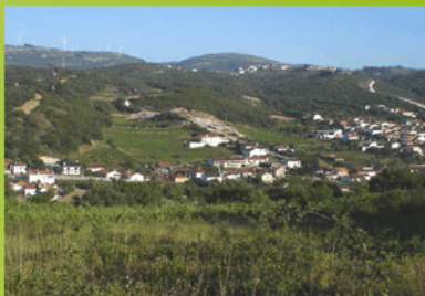
▲ Vista sobre Alcanadas

Continuando este percurso pela localidade, encontramos um marco representativo de uma tenda local acerca da "Arca de Noé" que, segundo os mais antigos, terá encailhado neste local.