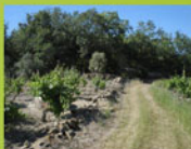
▲ Campos Agrícolas