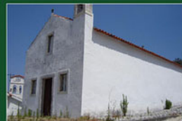
◀ Capela de S. Mateus