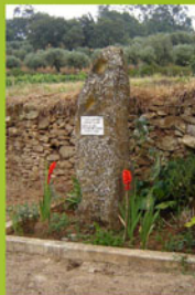
▲ Monumento à Arca de Noé ▶