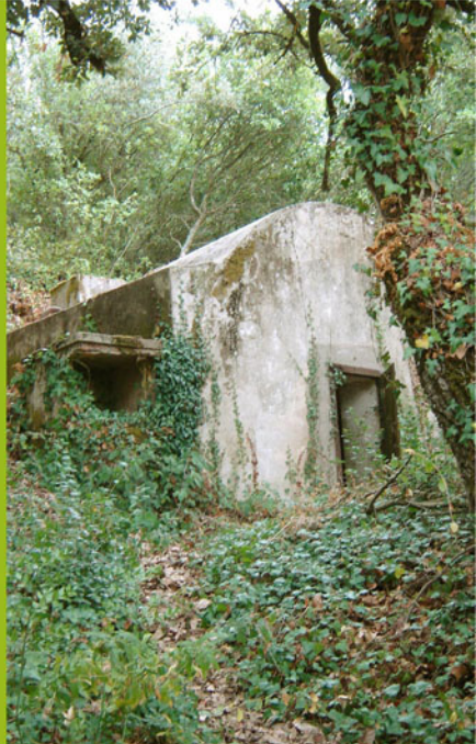
▲ Polvarinhos – locais onde se armazenava pólvora