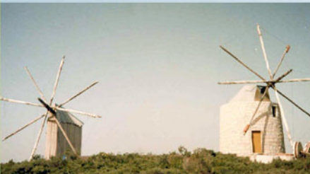
Moinhos do Cassaca

No sopé da encosta podemos observar a Rosa Albardeira, espécie em vias de extinção que se assemelha com a tulipa.