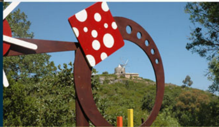
Passoio Rota dos Moinhos